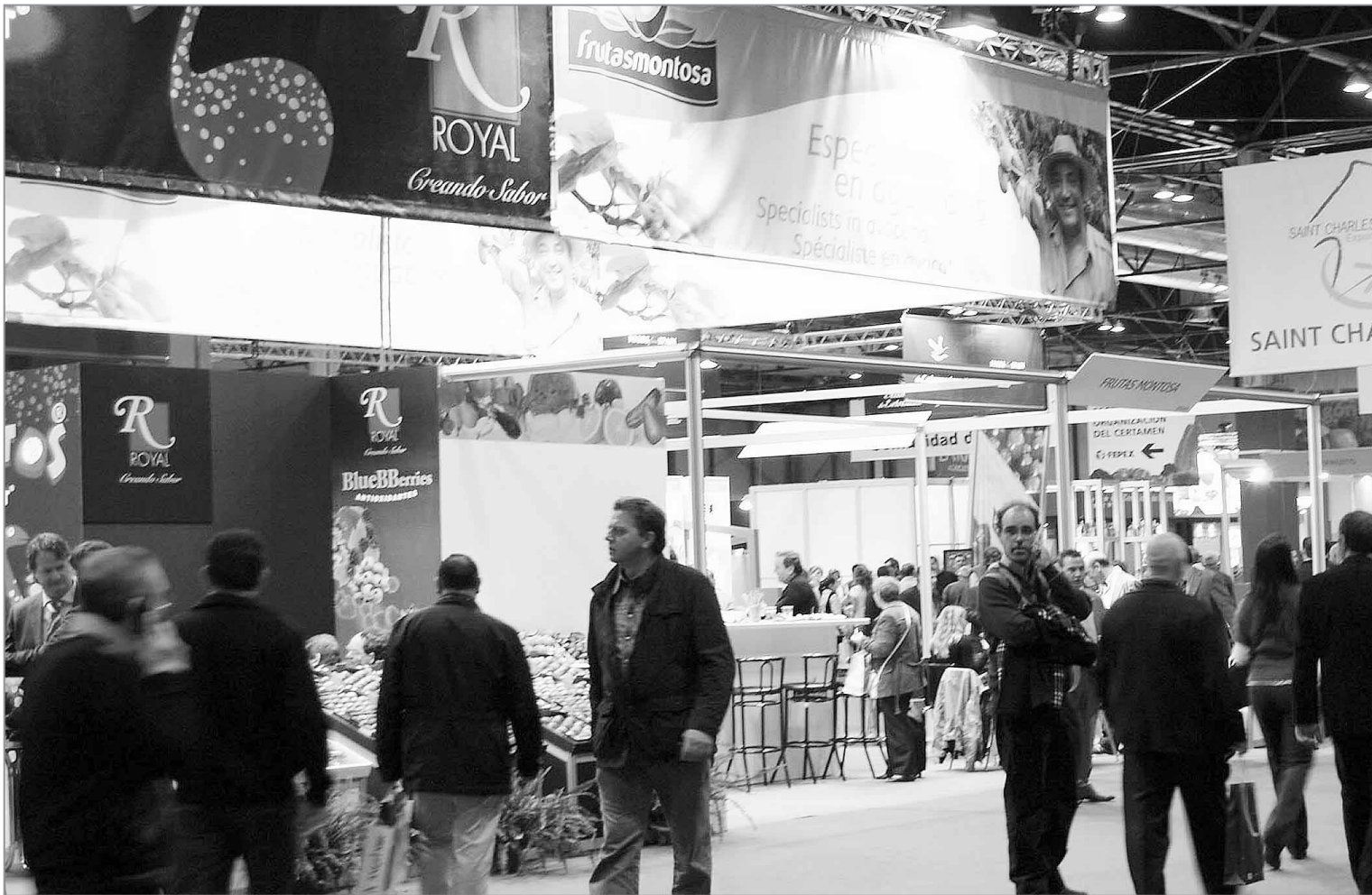
DIMENSIONES. Pese a que la mayor parte de expositores ha cumplido con sus expectativas, muchos se quejan de que la feria podría haber sido más grande en cuanto a espacio. / IDEAL