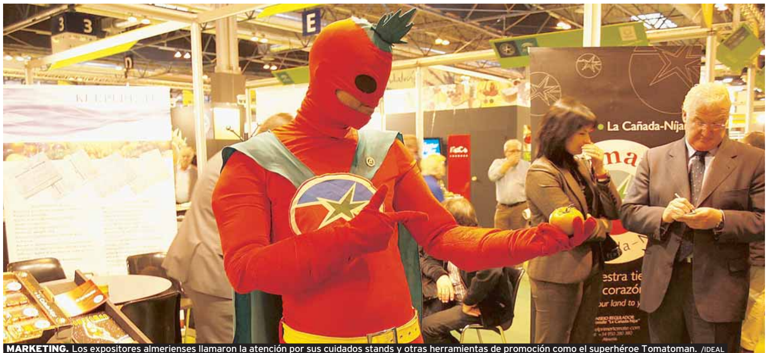
MARKETING. Los expositores almerienses llamaron la atención por sus cuidados stands y otras herramientas de promoción como el superhéroe Tomatoman.

Como en cualquier evento, la feria hortofrutícola de la capital de España también ha recibido algunas críticas. La mayoría de ellas se han centrado en destacar que los dos pabellones que la han albergado eran demasiado pequeños