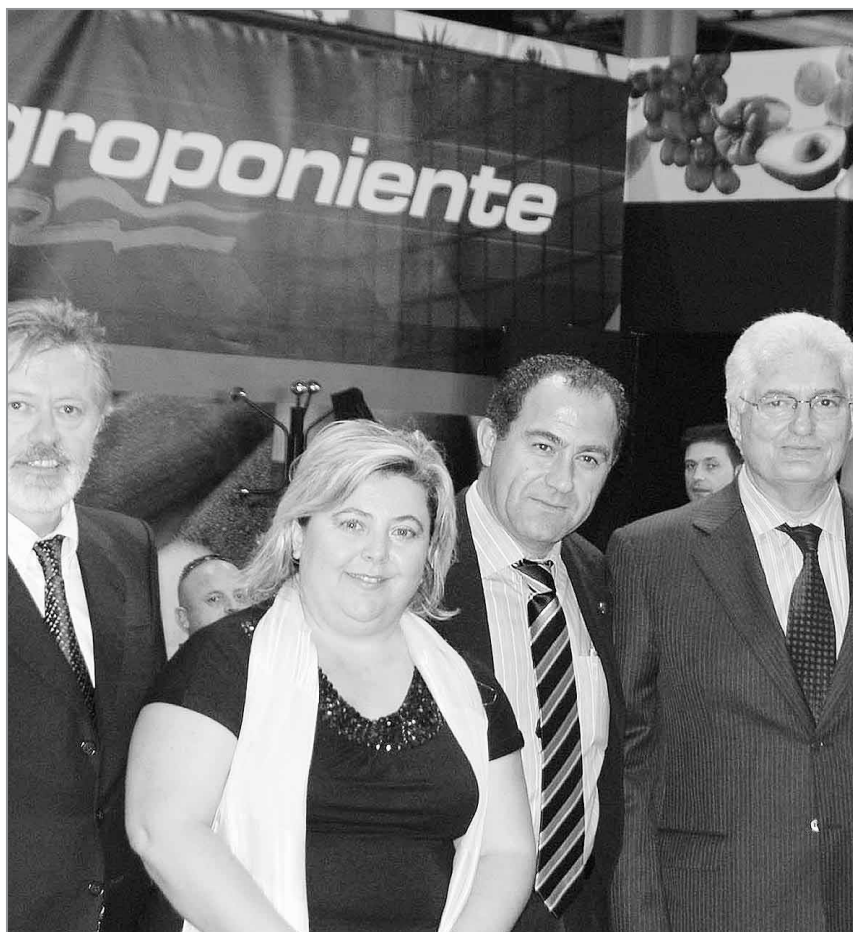
SATISFACCIÓN. Grupo Agroponiente supera sus expectativas iniciales en Fruit Attraction. / IDEAL