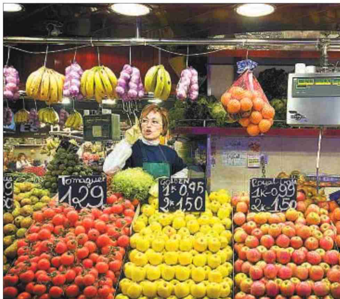
Los pabellones 1 y 3 se convertirán en una gran frutería.

“Se están cumpliendo todos los objetivos que, tanto desde la dirección de