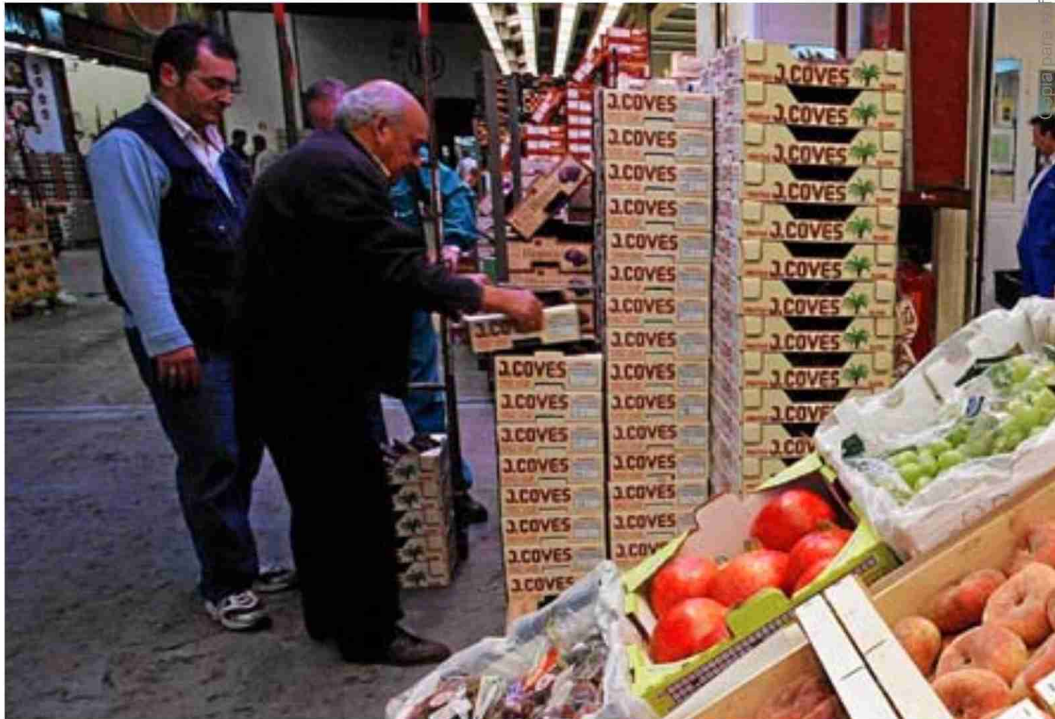
Distribuidores de fruta y verdura en las instalaciones de Mercamadrid.